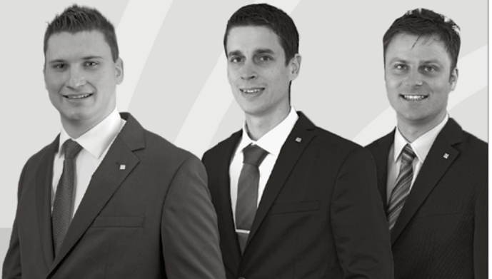
Emmenbrücke und Umgebung