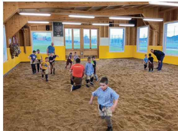
Das Piccolo-Training ist auch im Jahr 2023 sehr beliebt.