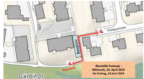
Skizze Baustelle Fussweg Friedastrasse.